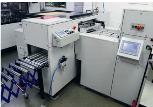
Im Linkslauf endet die tb flex in der tb-Stapelauslage, wo Sätze gezählt und zu Stapeln bis zu einer Höhe von 15 cm gesammelt werden und als Normal- oder Versetzt-Auslage aufs Band geraten. Im Rechtslauf endet das Zusammen-tragen in der Broschürenfertigung tb B 304 QSM, wo unter anderem der Drei-Seiten-Beschnitt vorgenommen wird.

2018 war für Blömeke ein wirtschaftlich gutes Jahr, was dazu führte, dass das Unternehmen 2019 in eine zusätzliche Fünf-farben-Offsetdruckmaschine mit Lackwerk im Mittelformat investieren konnte. Des Weiteren