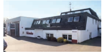
Blömeke in der Resser Straße in Herne beschäftigt 40 Mitarbeiter und gilt als Technik-Pionier. Bereits vor 17 Jahren eröffnete man den ersten Web-to-Print-Shop.

Dienstleistungen, wie etwa Design, Lagerung und weltweite Logistikdienste sowie das Programmieren von Shopsystemen oder das Einrichten von Bezahl-Schnittstellen etc. Seit jeher zeichnet sich das Unternehmen dadurch aus, dass es technologische Neuerungen verfolgt sowie frühzeitig adap-